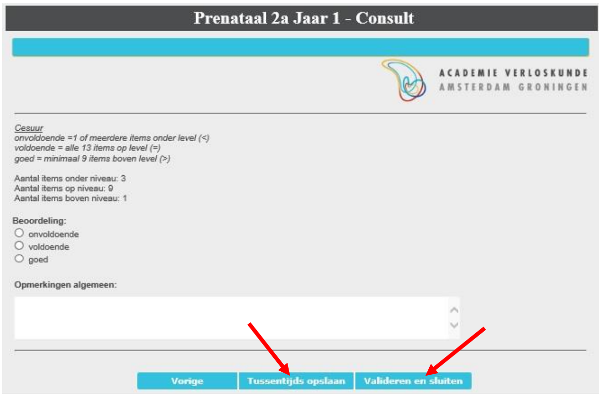
Figuur 4. Opslaan en sluiten beoordelingsformulier.